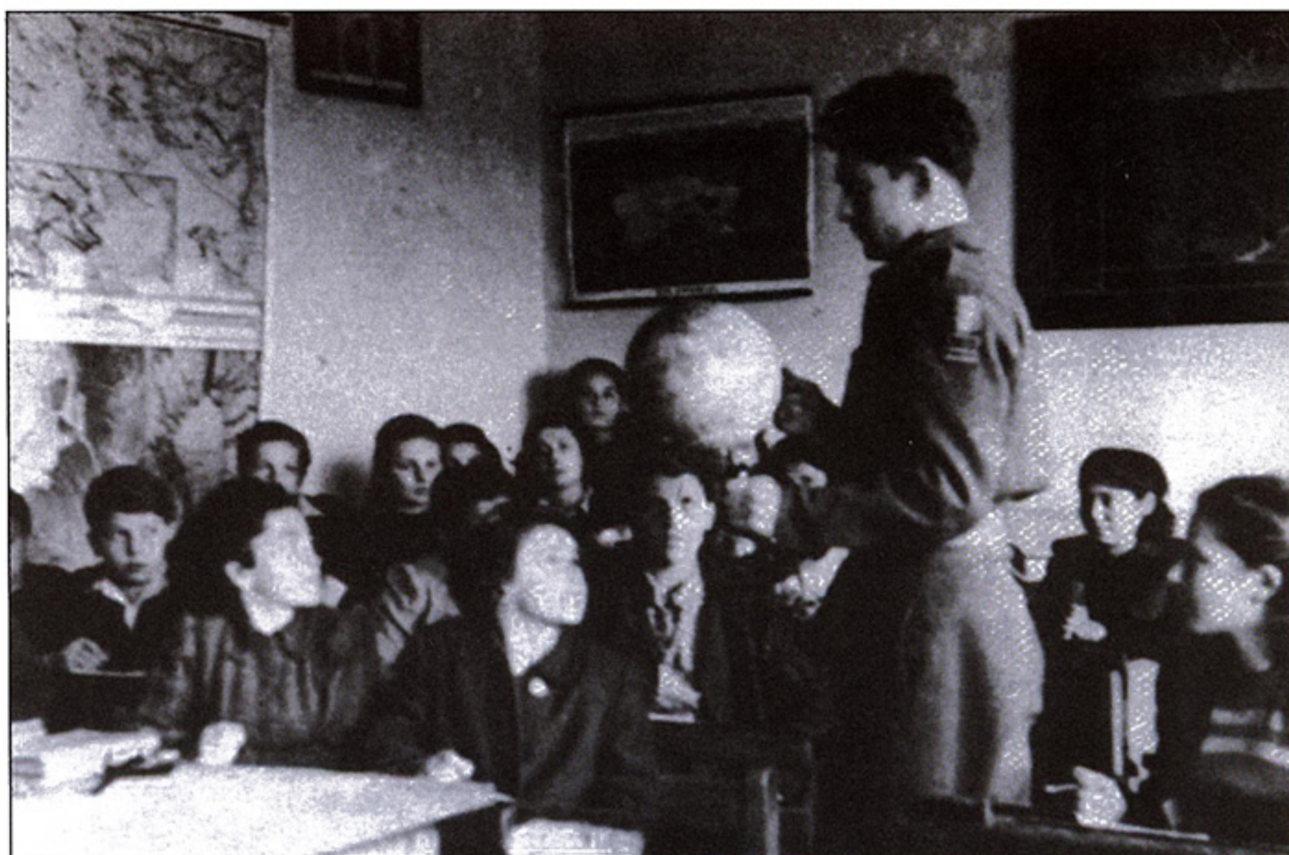
Unterricht unter erschwerten Bedingungen: Alle ziehen an einem Strang.

Angelika Eder ist Historikerin und Autorin einer fundierten Dissertation über die Geschichte des Landsberger DP-Lagers.