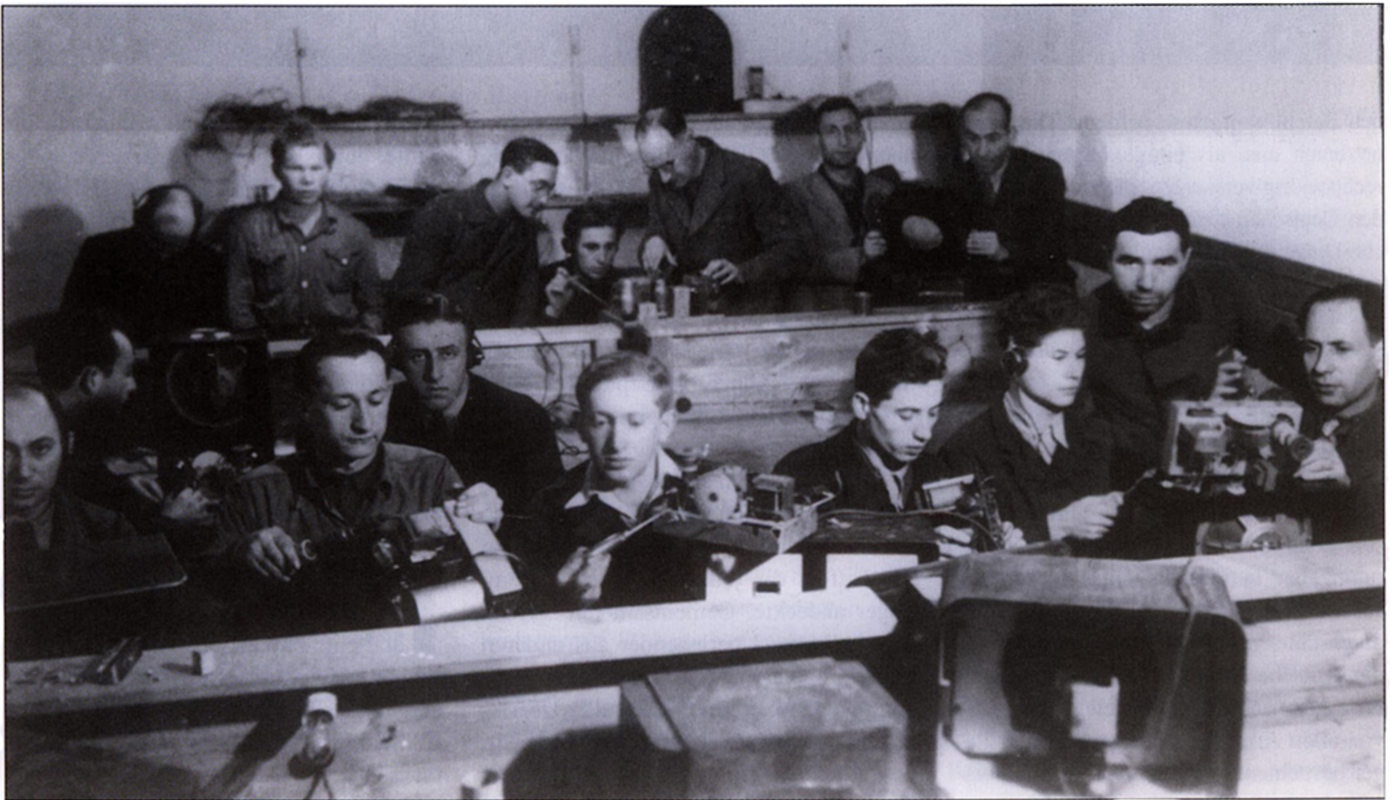
Lernen für „Eretz Israel“: Das „elektrische Zenter“ in der Saarburg-Kaserne