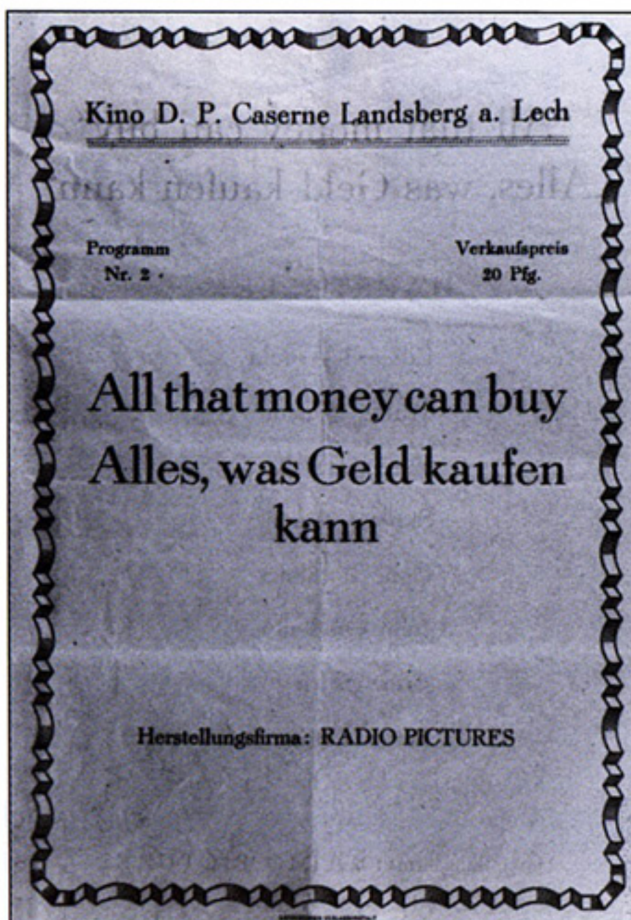
Sport, Kino und Theater: Anzeigen und Flugblätter zeugen vom kulturellen Angebot im Landsberger DP-Camp.