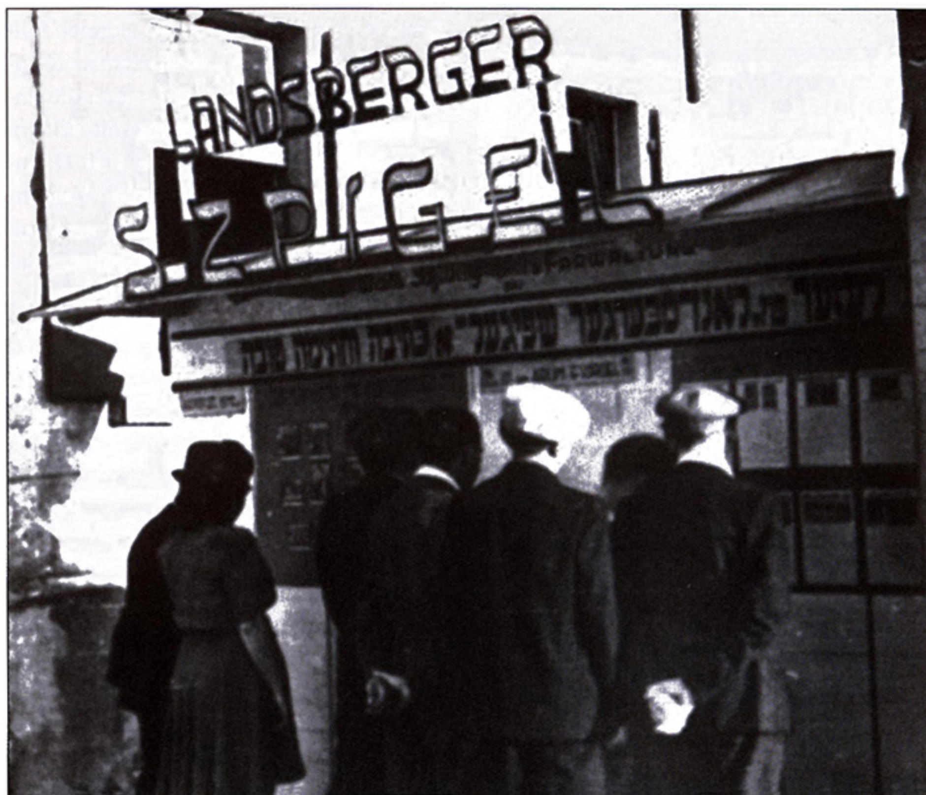
Wandzeitung: Am „Landsberger Szpigel“ finden die DPs aktuelle Informationen

Ein Höhepunkt auf anderem Gebiet waren die Auftritte des Fußball-Clubs „Ichud“. Die Landsberger DP-Mann-